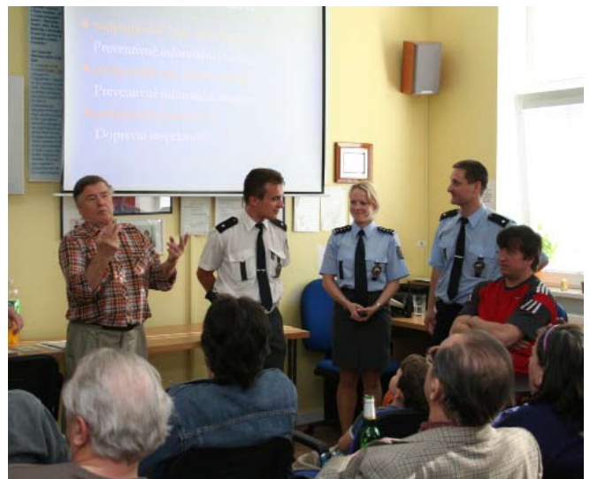
Probíhají vzdělávací přednášky tlumočené do znakového jazyka