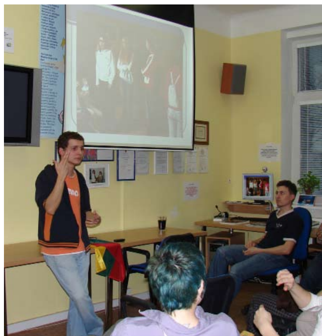
Využíváme vizuální prostředky a výpočetní techniku