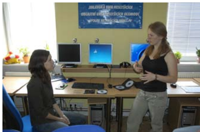
Komunikujeme ve znakovém jazyce