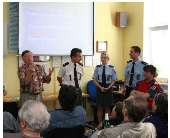
Probíhají vzdělávací přednášky tlumočené do znakového jazyka