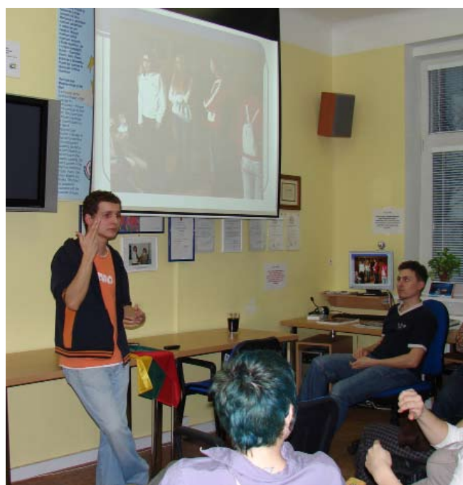
Využíváme vizuální prostředky a výpočetní techniku