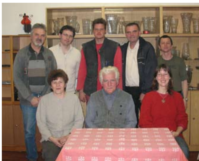
Výbor Jihlavské unie neslyšících

Ministerstvo kultury Automotive Lighting Bosch Diesel Jihlava Mikcars