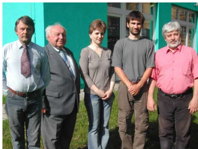
Výbor Oblastní unie neslyšících Olomouc

Charakteristika uživatele služby – osoby se sluchovým postižením, rodiče, eventuálně osoby blízké dětem se sluchovým postižením, všechny uvedené skupiny osob bez omezení věku.