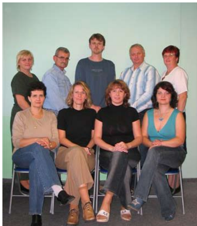
Výbor Plzeňské unie neslyšících

■ Hospodářská správa – drobné opravy, údržba a úklid.