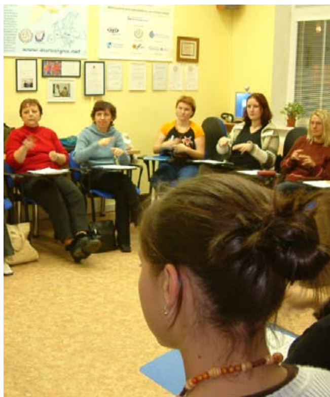
Pořádáme kurzy znakového jazyka pro sluchově postižené a širokou veřejnost

O stále zvyšující se oblíbenosti této služby svědčí i to, že v době mobilních telefonů a možnosti posílat SMS uskuteční přibližně 2 300 hovorů za měsíc.