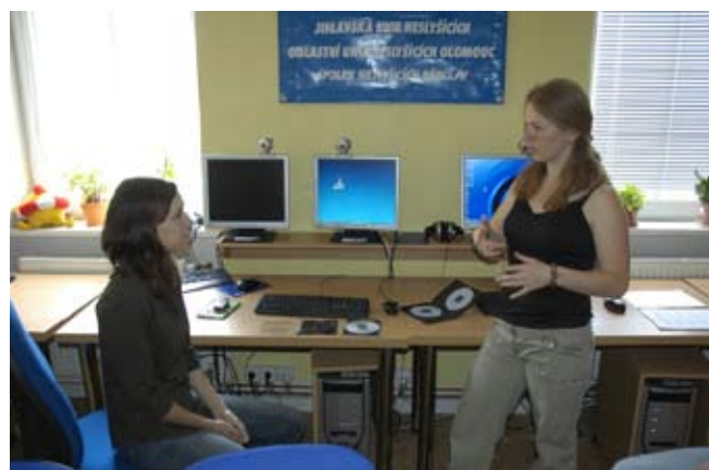
Komunikujeme ve znakovém jazyce