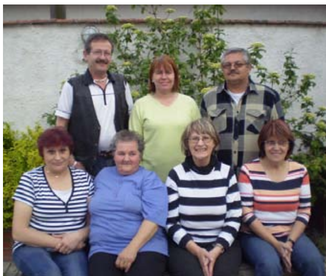
Výbor Spolku neslyšících Břeclav