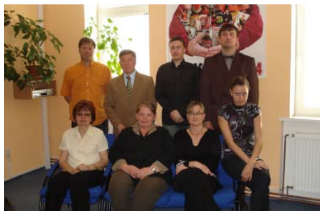
Výbor Unie neslyšících Brno

Cílová skupina – osoby se sluchovým postižením všech věkových kategorií