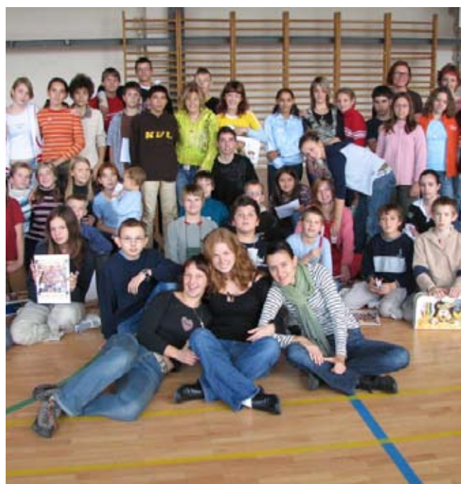
Podporujeme komunikaci mezi neslyšícími a slyšícími dětmi