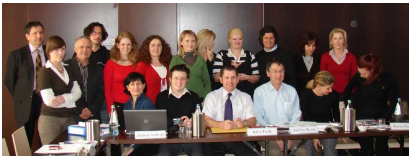
Pracovní setkání partnerů projektu JOS – Bolona