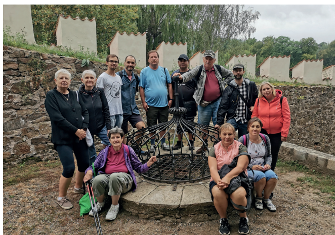
Objevujeme krásy ČR – Písek

Malá foto-ochutnávka z činnosti Plzeňské unie neslyšících, z.ú. v roce 2022: