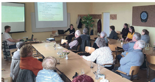
Přednáška o pokladech Hostýnských vrchů