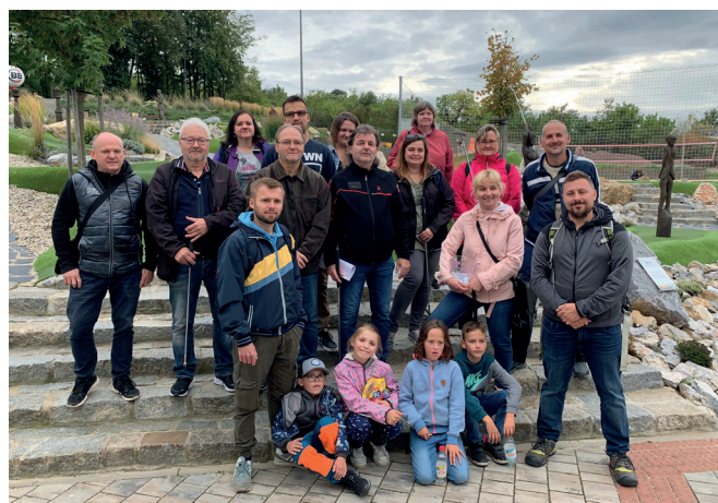
Turnaj v minigolfu