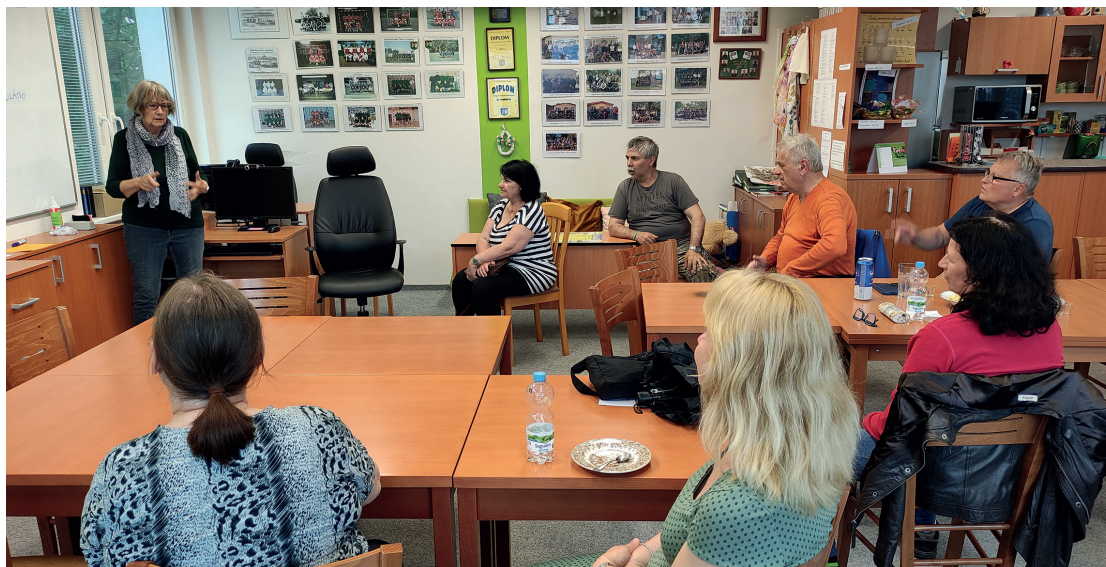
Slovník cizích slov