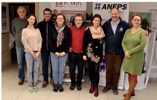
Jednání v ANEPS v Žilině