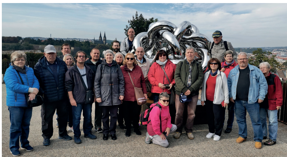
Objevujeme krásy ČR – Praha 3

a ještě více z aktivit PUN naleznete na www stránkách , Facebooku , YouTube nebo Instagramu