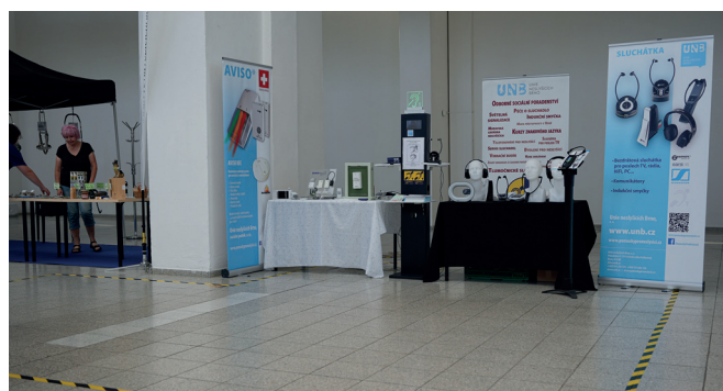
Unie neslyšících Brno prezentuje služby na Dnech mobility na BVV