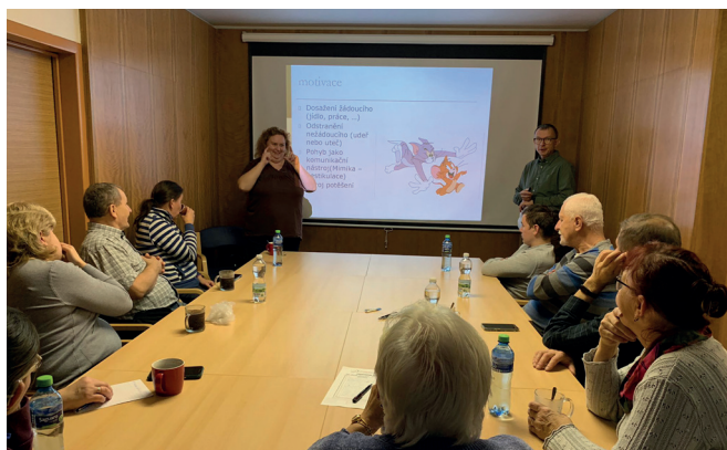
Přednáška o zdravém pohybu ve Valašském Meziříčí