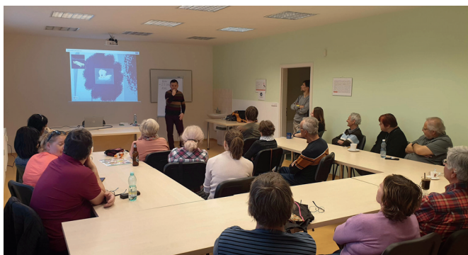
Přednáška medvěd polární a jeho budoucnost