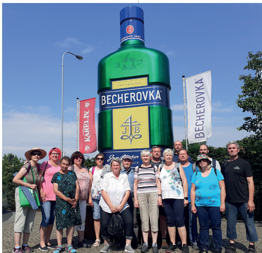
Objevujeme krásy ČR – Karlovy Vary