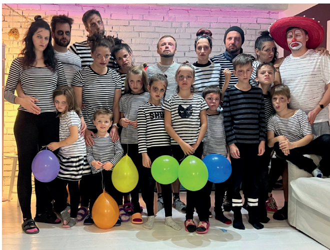
Halloween pro děti i dospělé