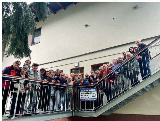
Pobytová akce u Orlické přehrady