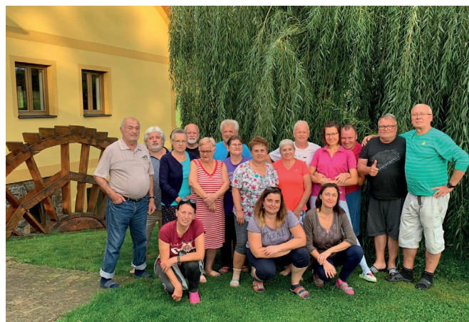
Pobytová akce Podveský mlýn