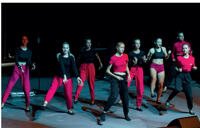
Dětská taneční skupina DANCE POWER Kroměříž