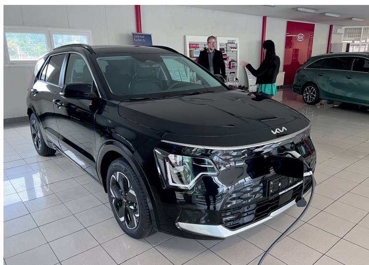
Unie neslyšících Brno má nový elektromobil

https://www.unb.cz/portfolio/zefektivneni-terennich-sluzeb-unie-neslysicich-brno/