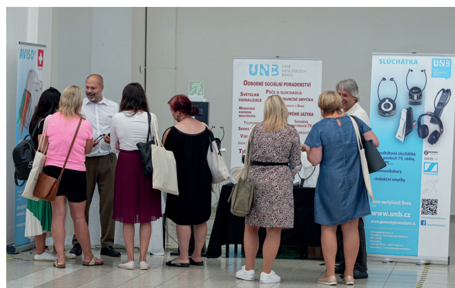
Dny mobility v Brně na BW