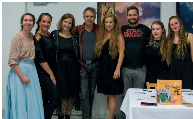
Neslýchaně zábavný večer proběhl v úžasné atmosféře!