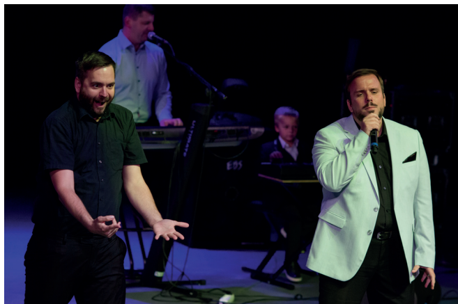
Duo Karel Gott revival Morava nabídly největší hity Karla Gotta!