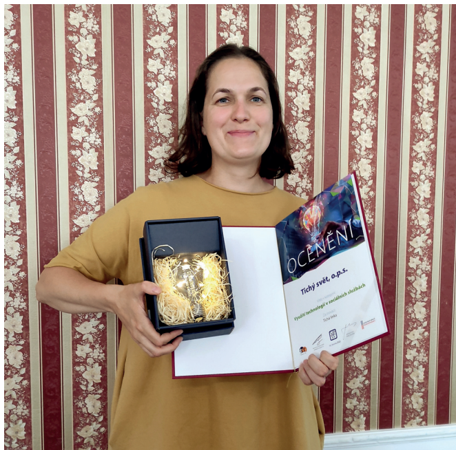
CENA – Inovace v sociálních službách

Toto ocenění a velké díky patří hlavně všem tlumočnickům a přepisovatelům, kteří každý den odvádí skvělou práci.