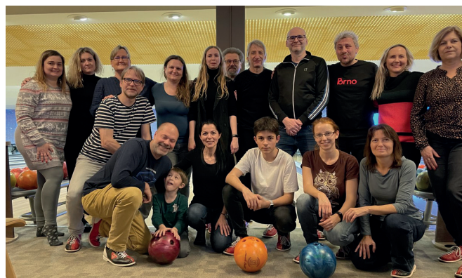
Kolektiv zaměstnanců Unie neslyšících Brno

Podle zákona č. 108/2006 Sb. o sociálních službách je Unie neslyšících Brno, z.s. zaregistrovaná na služby: tlumočnické služby a odborné sociální poradenství.