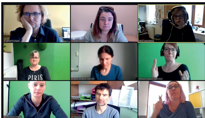
On-line jednání zástupců organizace 26. 4. 2022