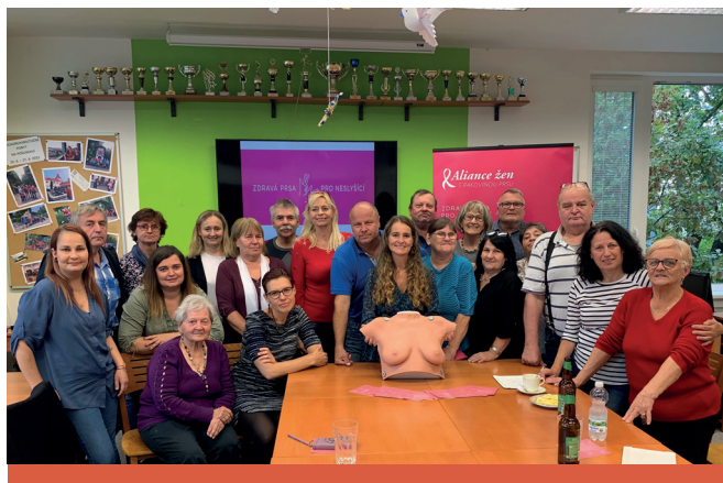
Přednáška zdravá prsa