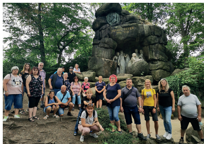
Objevujeme krásy ČR – Praha