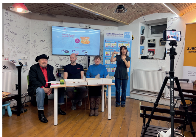
Tlumočení besedy o cukroví