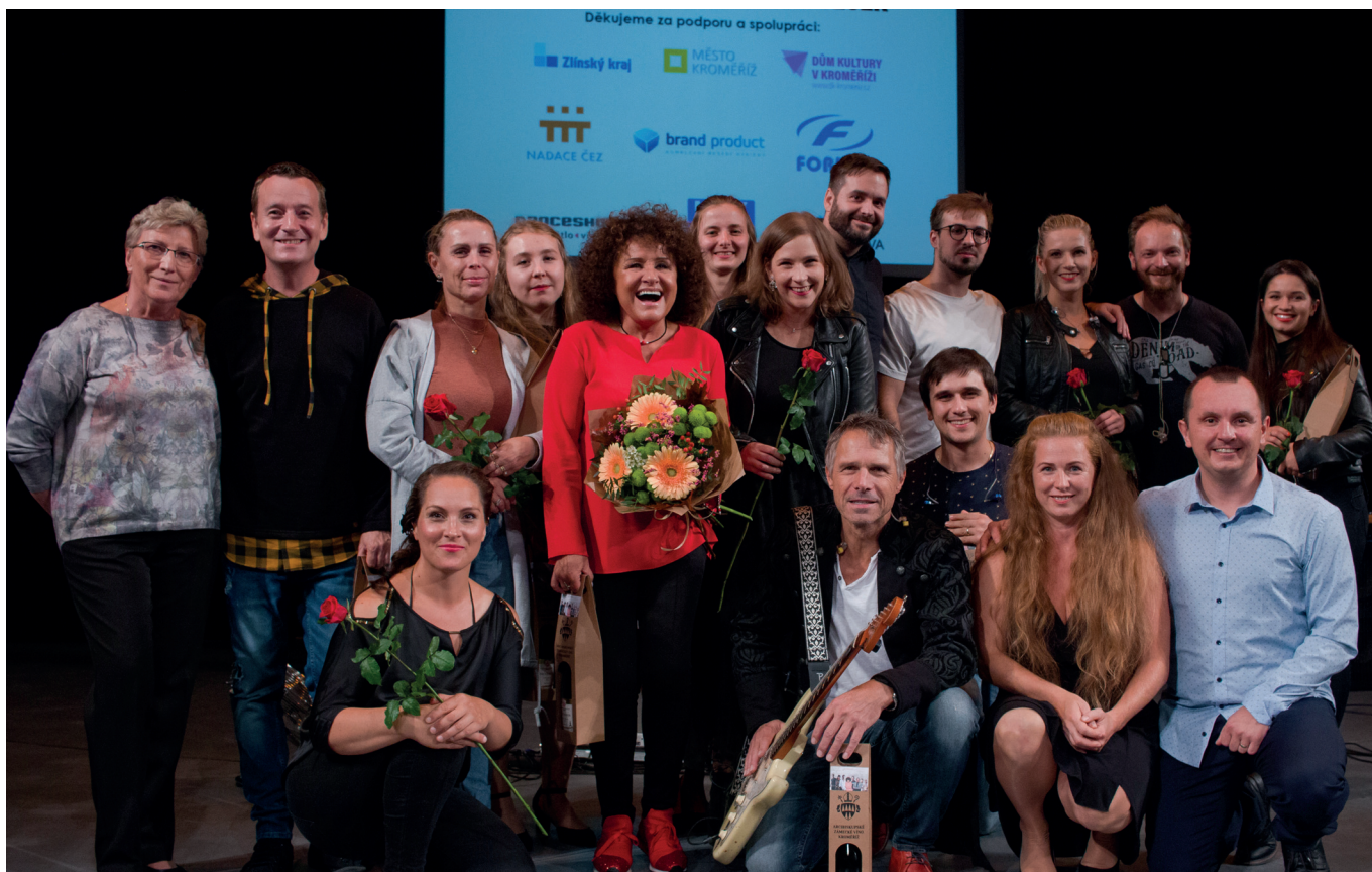
Závěrečná „děkovačka“ vystupujících.