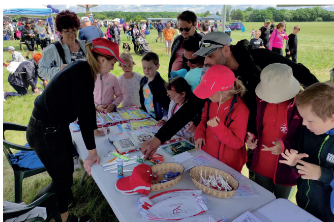
Den dětí města Kroměříže