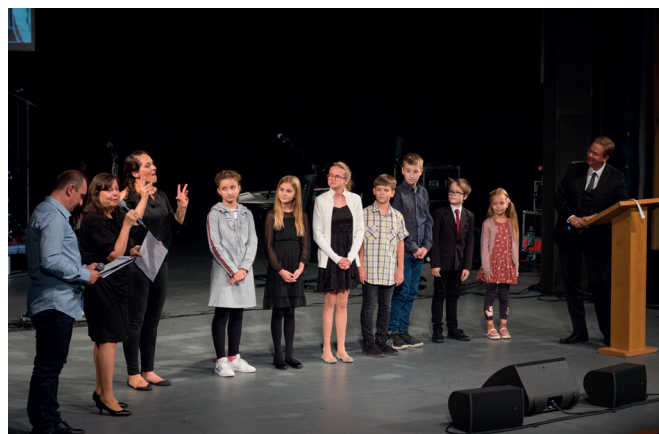
Vyhlášení vítězů proběhlo v rámci programu Neslýchaně zábavného večera