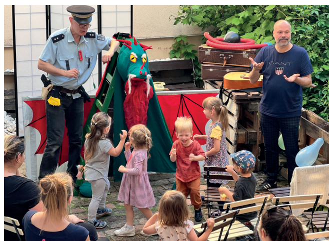
Den dětí – Policejní pohádka