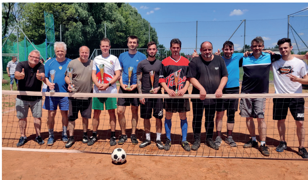
Turnaj v nohejbalu