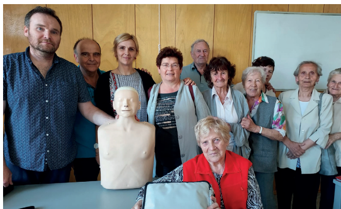
Přednáška o první pomoci v Uherském Hradišti