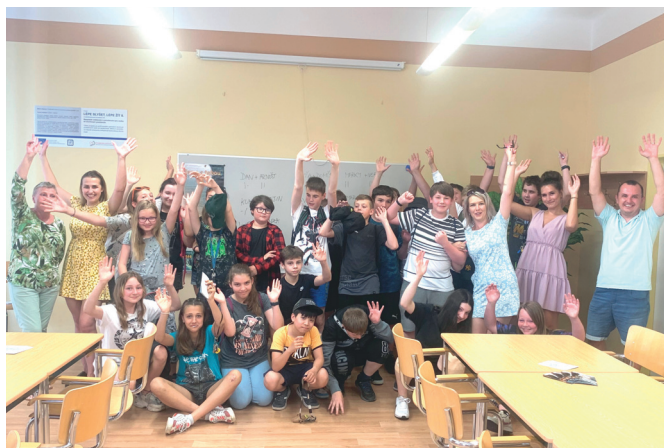
Exkurze dětí mají úspěch