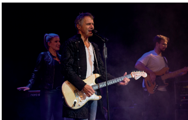
Janek Ledecký zvedl diváky ze sedadel!