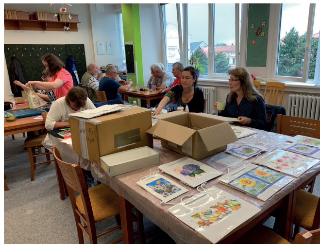
Výtvarka – výroba tašek