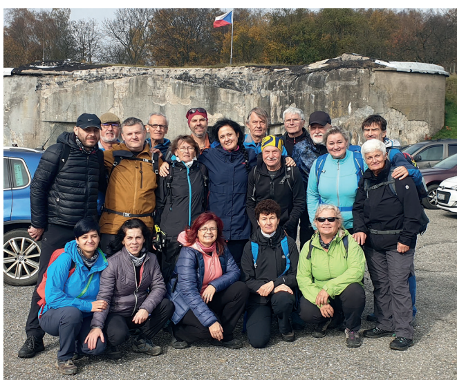
Pobyt – výlet