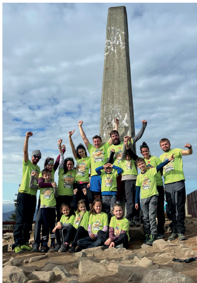
Pobytová akce v Beskydech

Spolek neslyšících Břeclav uspořádal v srpnu 2022 týdenní pobyty v Pošumaví.