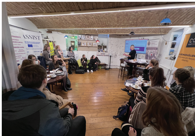
Den otevřených dveří v Brně

Hradecké centrum v Hradci Králové uspořádalo Den otevřených dveří s prezentací služeb a besedou o komunikačních bariérách.