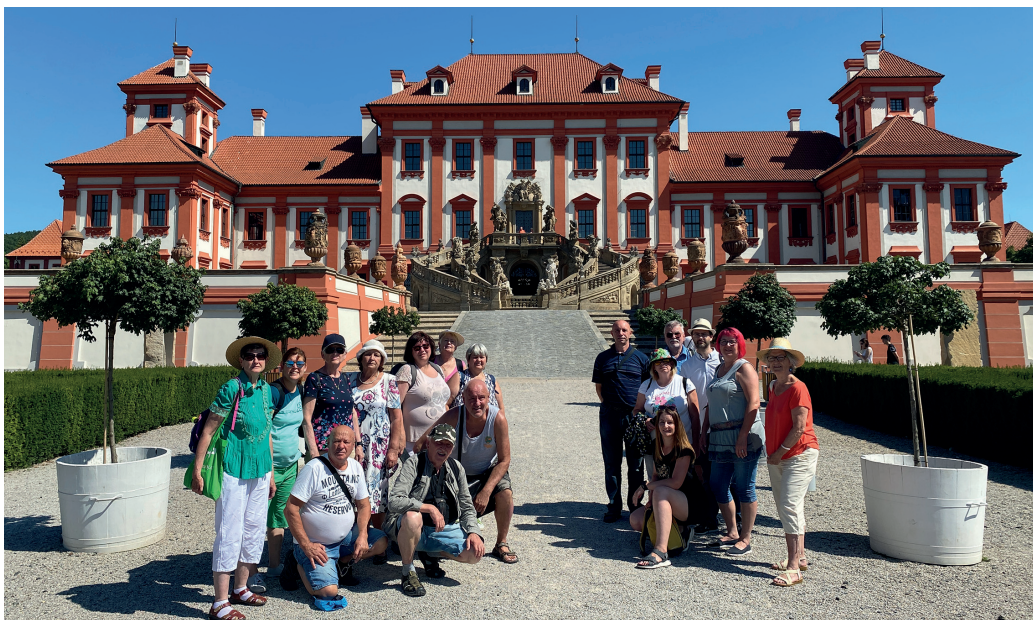
Objevujeme krásy ČR – Praha 2