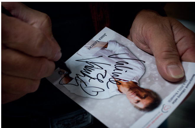
Nechyběla ani tradiční autogramiáda vystupujících