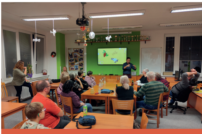
Přednáška o včelách