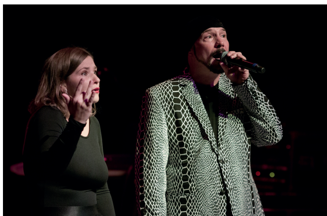
Bohuš Matuš zazpíval největší hity W. Matušky!