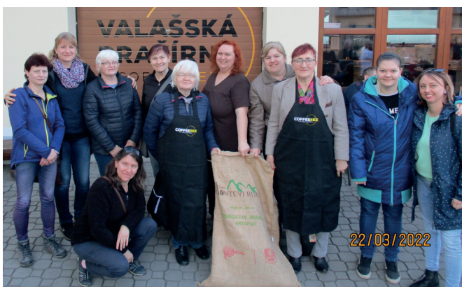
Příběh kávy ve Valašském Meziříčí