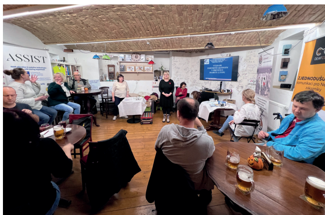
Přednáška o diabetu

Dále jsme uspořádali celkem 50 přednášek se zdravotní tematikou, např. o prevenci onkologických onemocnění, dentální hygieně, první pomoci, diabetu, jak cvičit paměť, o pomůckách pro sluchově i zrakově postižené a mnoho dalších.