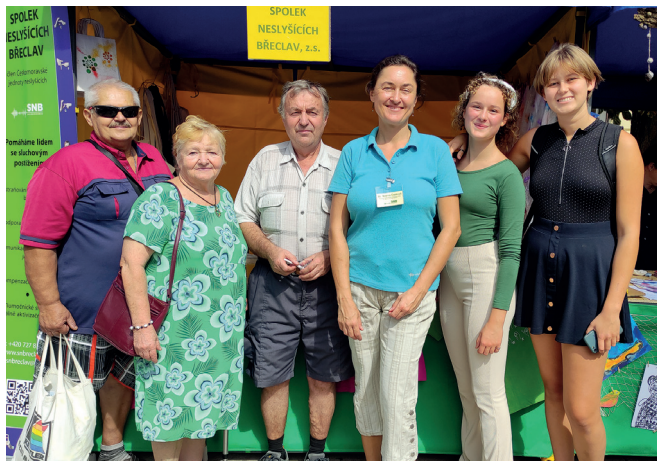
Den sociálních služeb