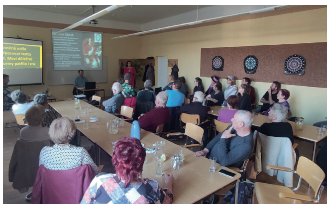
Přednáška o Marii Terezii