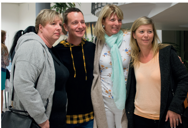
Každý se mohl vyfotit se svým idolem