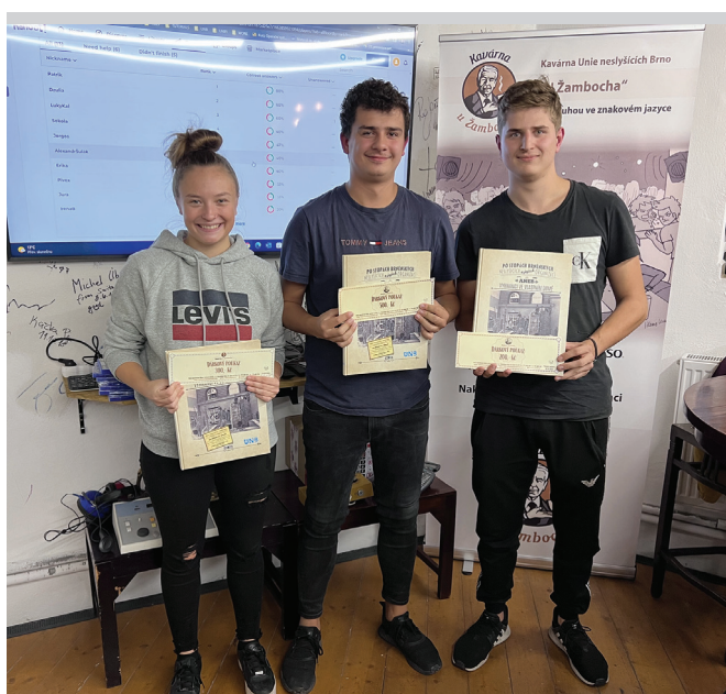
Vítězové soutěže v rámci Mezinárodního dne neslyšících