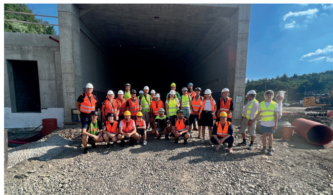
Prohlídka stavby tunelu v Brně

Jihomoravskému kraji, Magistrátu města Brna, Ministerstvu zdravotnictví, Ministerstvu kultury, Úřadu práce, Městské části Brno-Královo Pole.