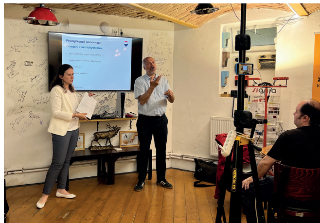
Tlumočení přednášky o nemovitostech

■ Kapacita služby – ambulantní okamžitá: 3 – terénní okamžitá: 4