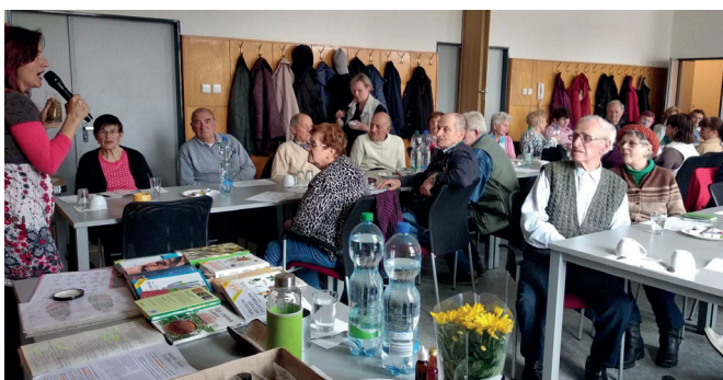
Přednáška o bylinkách v Uherském Hradišti